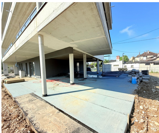
Façade pilotis — accès parkings