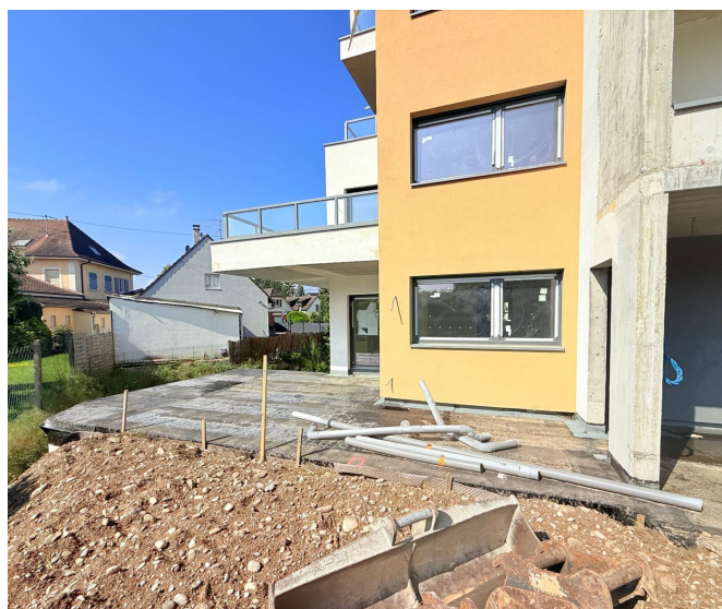
Pignon orange — détail architectural