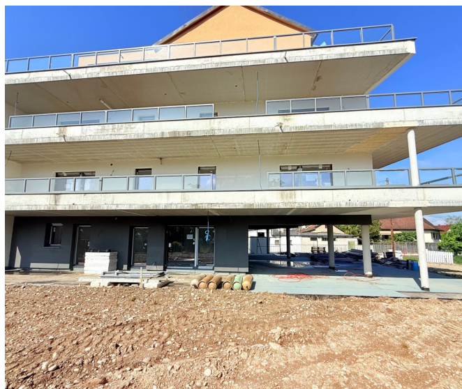
Façade balcons — Sud-Est