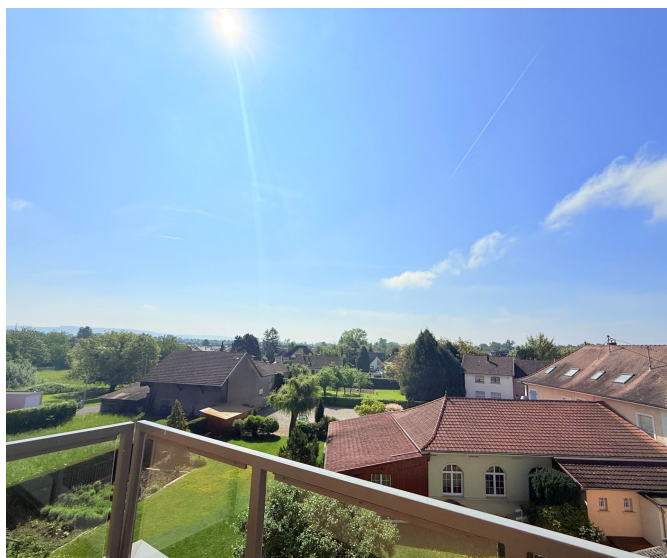
Vue depuis le balcon Sud