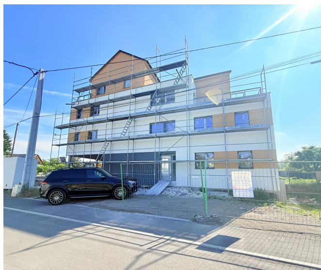
Façade rue — entrée principale