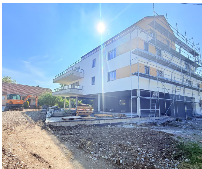
Façade Nord — vue d'ensemble