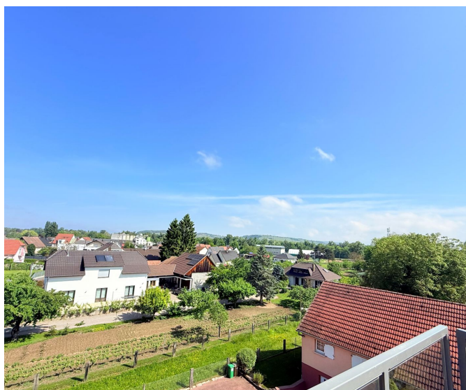
Vue dégagée depuis l'attique