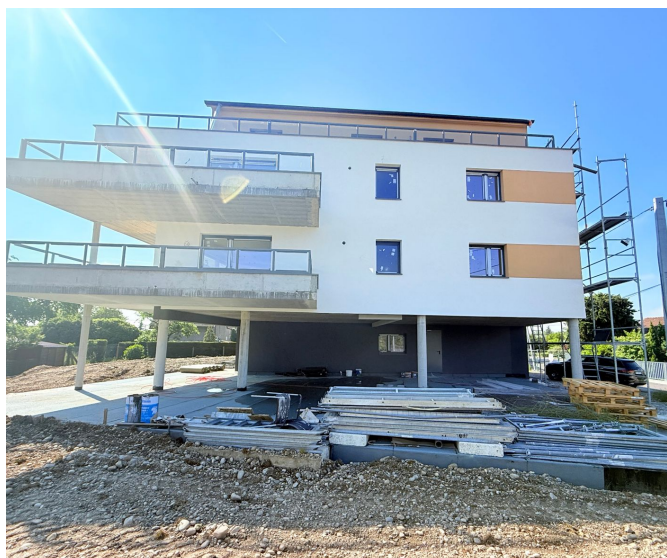
Façade jardin — côté terrasses