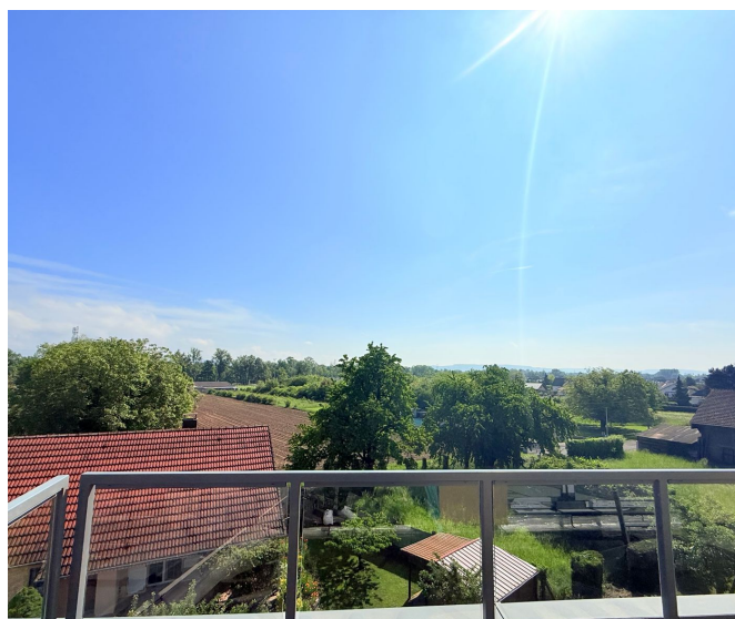
Panorama plaine d'Alsace